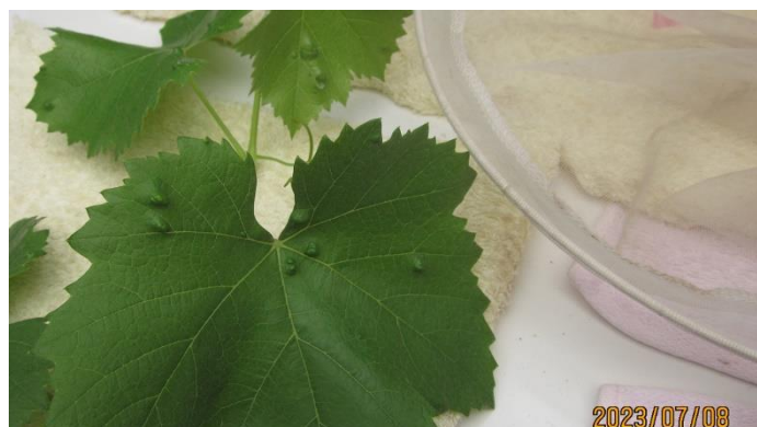
恐ろしいのは黄金虫だけではありません。膨らんでいるのが素潜りダニの巣になります。この写真は少しですが、全体に広がると葉が枯れてしまいます。黄金虫も素潜りダニも侮れません。徹底除去です。