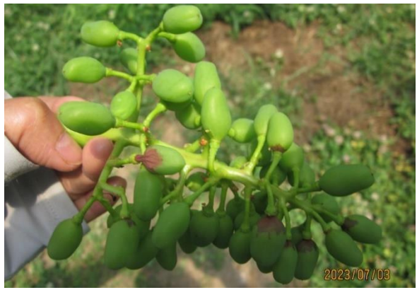
日焼けにより実が縮んだ