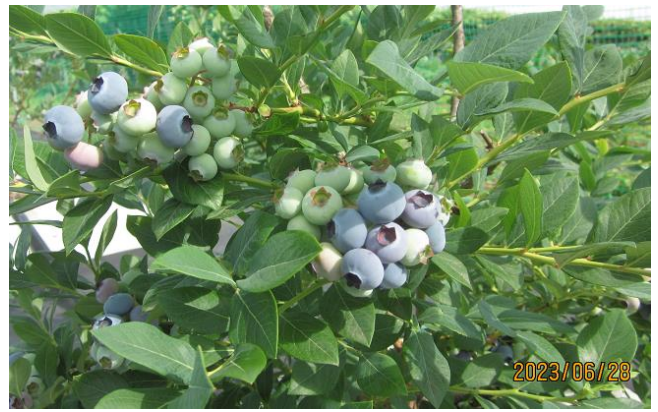
6月28日です。ラズベリーとブルーベリーが今年もたくさん収穫できそうです。