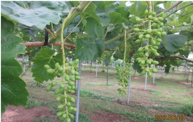
6月30日です。クィンルーシュ ジベ2回目と1日後