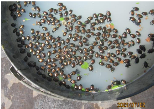
7月8日です。黄金虫の大量発生です。殺虫剤が1日しか効果がないため6月下旬から毎日、虫捕り網で捕獲しています。7月8日は何匹捕まえたか数を数えたら1,000匹になりました。葉の葉脈を残して食べられてしまいます。